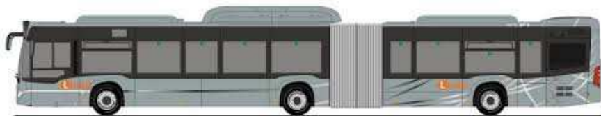
6 Linéo en service, 10 lignes en 2020 (Schéma Directeur Linéo)

Linéo est le fruit d'un dosage entre aménagement, offre de service et intégration dans les espaces traversés.