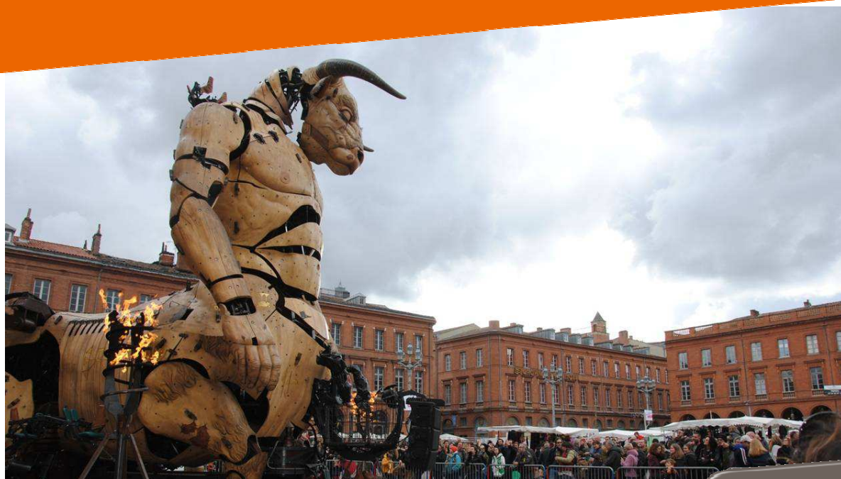
@ Le Minotaure – Halle de la Machine – pouvant transporter 50 personnes